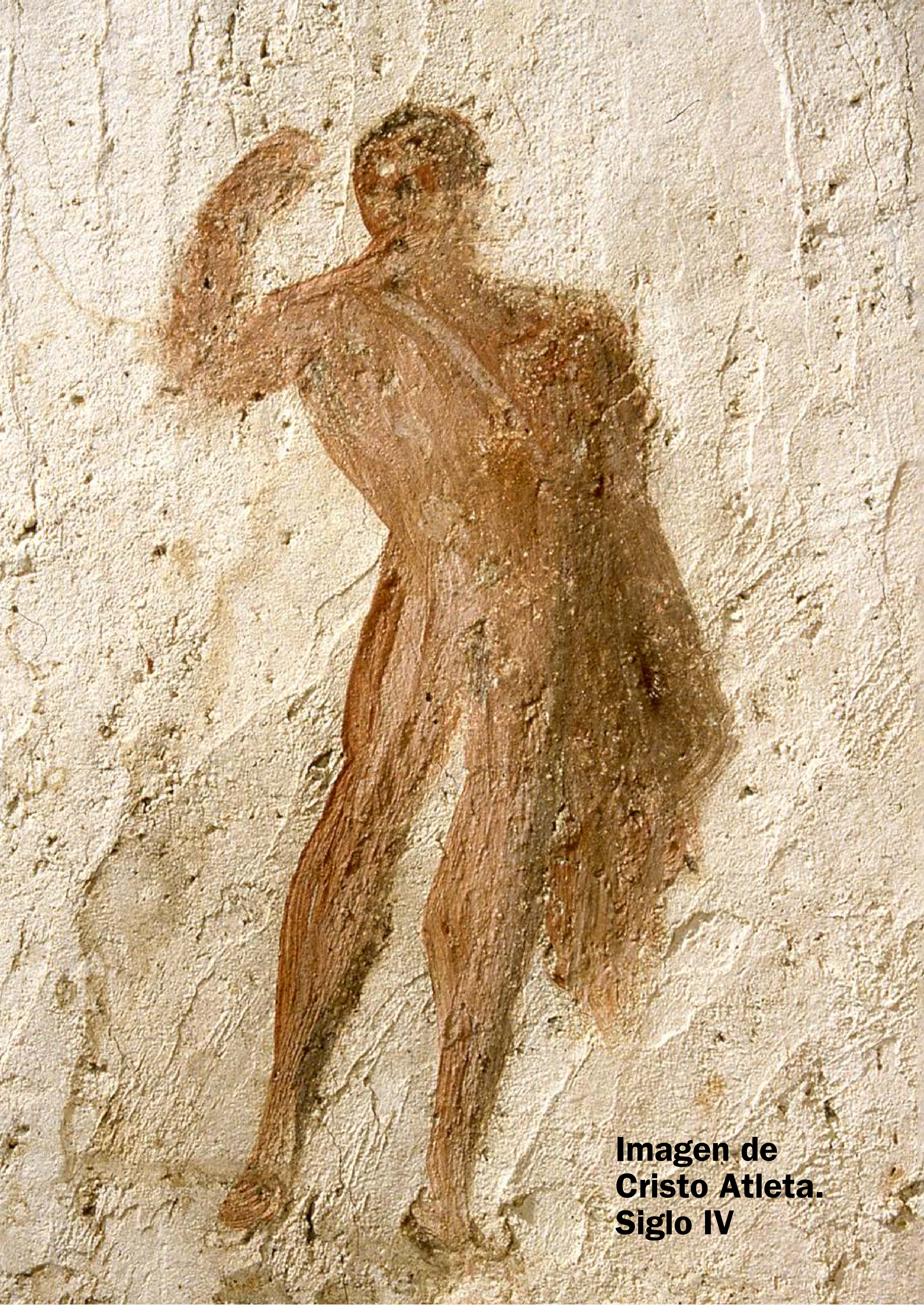
Imagen de Cristo Atleta. Siglo IV